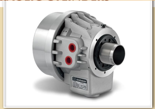
寸法図 >> Dimensions